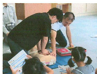
7/5 P T A救急救命講習会