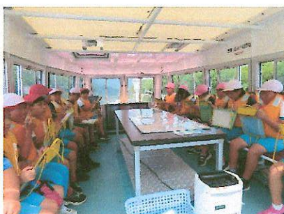
7/9 5年生ゆはず乗船体験