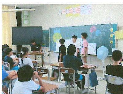
7/10 6年生滝沢小との交流