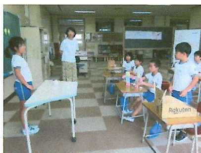
8/25 夏休み作品・自由研究発表会