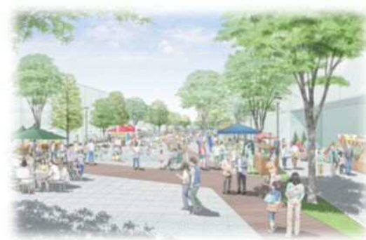
プロムナードのイメージ