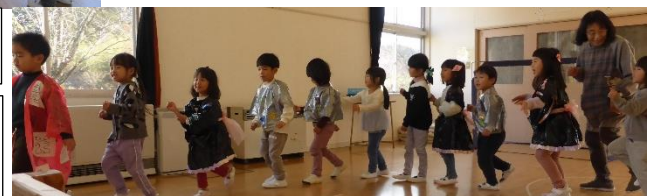
みんなでそっと… ♪ぬきあし さしあし のびあし…♪

発表会の取り組みを通し、クラスの友達やクラスを超えた異年齢の間わりの中で、相手に認められる心地よさや、自分が経験した気持ち、してもらった嬉しさから、友達にもやってあげたいという思いやりの気持ち、みんなで一緒にやることの楽しさ・満足感をより感じている姿が見られました。行事を経験することで『表現する楽しさ』はもちろんですが、心にとくさんの学びを得てまたひとつ大きくなった子供達です。