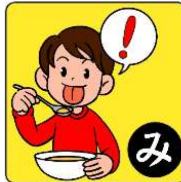
みかく はったつ 味覚が発達する