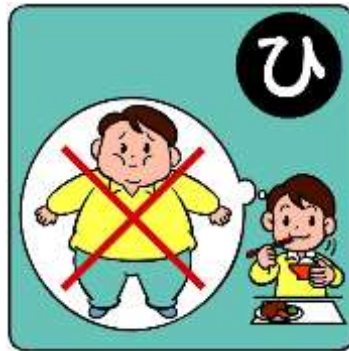
ひまん ふせ 肥満を防ぐ