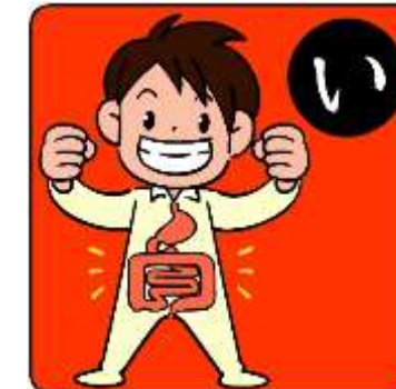
いちよう はたら 胃腸の働きをよくする