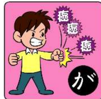
がん よぼう がんを予防する