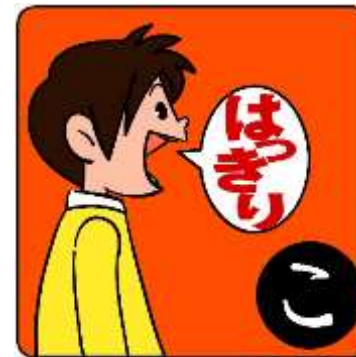
ことば はつおん 言葉の発音はっきり