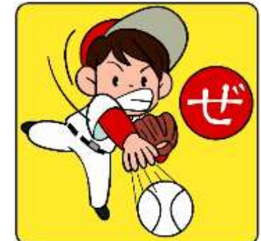
ぜんしん たいりょくこうじょう 全身の体力向上