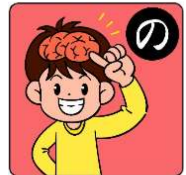
のう はたら かっぱつ 脳の働きを活発に